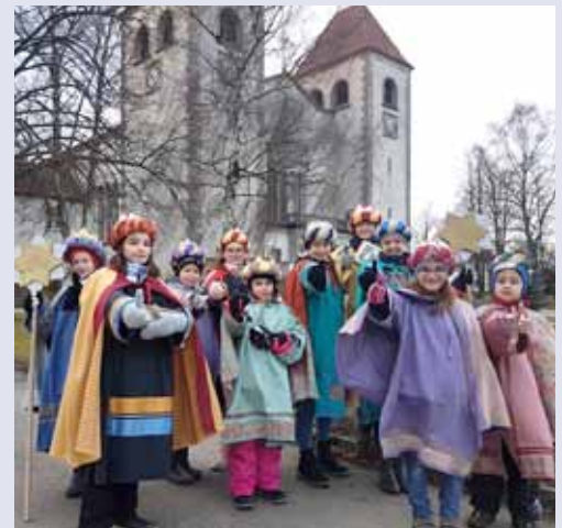
Wir danken den Sternsängern unserer Pfarre für ihren Einsatz!