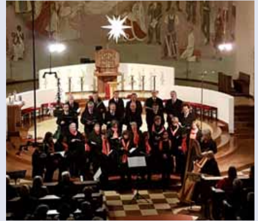
Der Kirchenchor lud am 8. Dezember zum Adventkonzert.