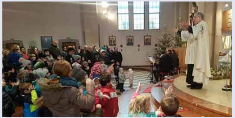
Über 150 Kinder waren bei der Kindersegnung am 28. Dezember in unserer Kirche versammelt.