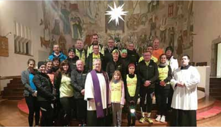
Am 23. Dezember überbrachte das Laufteam das Friedenslicht. Fast 29 km legten sie von Zwettl zurück.