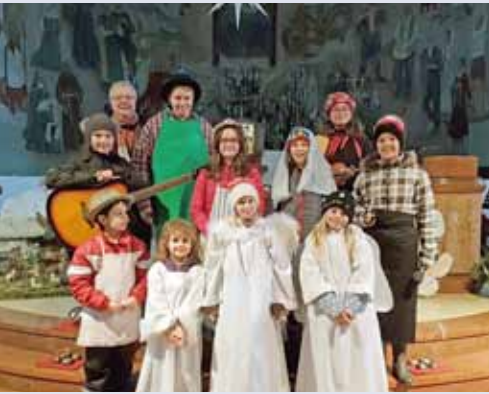
Bei der Kindermette gab es auch heuer wieder ein Krippenspiel.