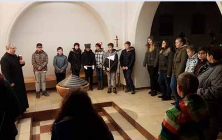
Mitte Jänner begann die Firmvorbereitung in unserer Pfarre. Wir wünschen eine schöne Vorbereitungszeit.